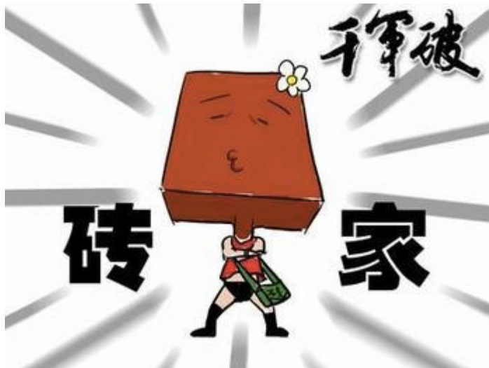
Hieroglifs Tsyinänik sinifons ,bakastonisevan'.

Plän: hieroglif balid ( ▪ ) de vöd „sevan“ ibinatoy ko hieroglif „ston“ (石), kel pagebon pö vöd „bakaston“. Vödapled (telsinifige vöda) sinifon, das jäfūdisevans at binons solidiku äsvo bakastons (sevabo, fümälik) pö desir okik ad dünöfikön (bönön yufoti) cifode e belugön pöpi.